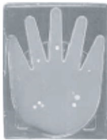
石鹸による手洗い