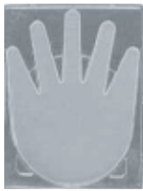
さらに、フォルテクターⅡ噴霧